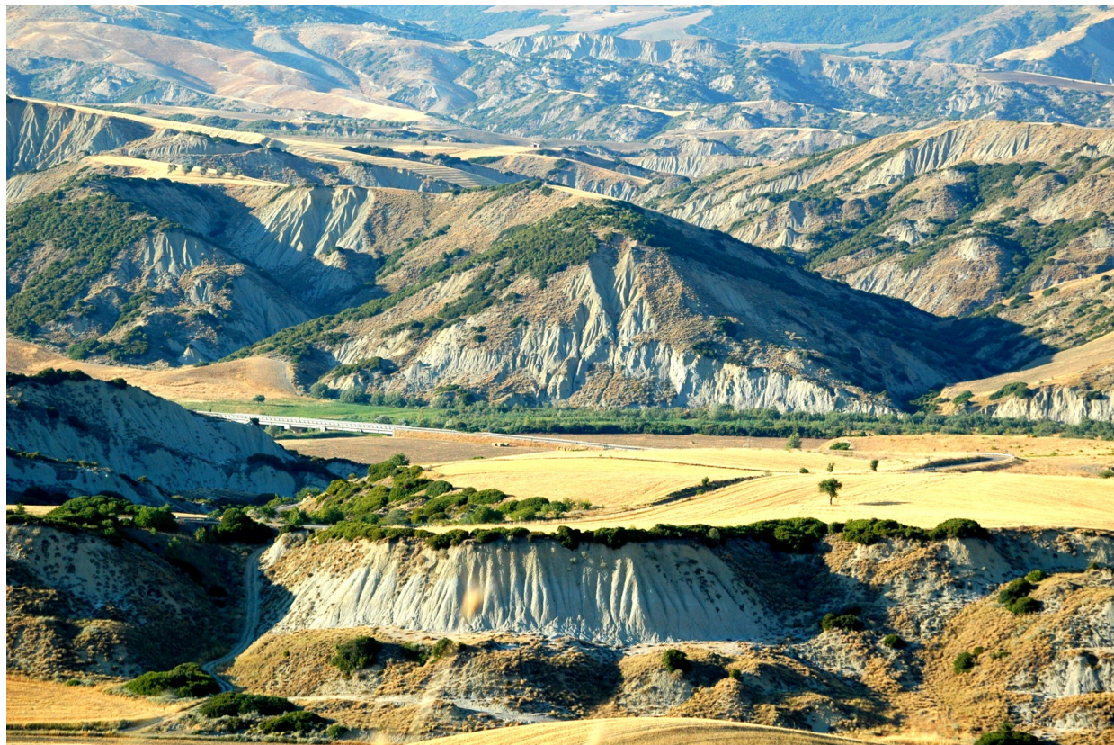
tipico paesaggio calanchivo nei pressi di Craco (MT)